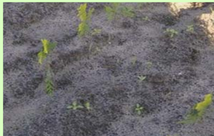
Butisan + contactmiddel