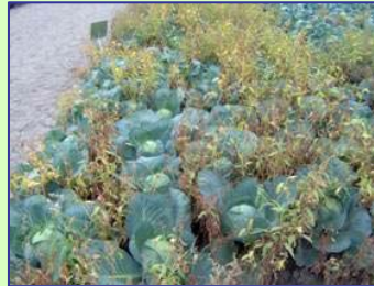
Butisan + Centium