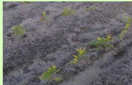
Butisan + contactmiddel + Grounded

In de eerste week na toepassing viel 30 mm regen. In het object met Grounded was na enkele weken nog geen onkruid te vinden terwijl in het object zonder Grounded de onkruiden wederom opkwamen. Grounded voorkwam uitspoeling van de bodemherbiciden. (Praktijkproef Vlamings B.V.)